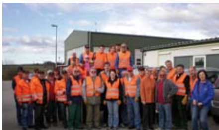
Viele fleißige Hände halfen bei der Ortsreinigung mit!

An dieser Stelle ein herzliches Dankeschön an alle freiwilligen Helferinnen und Helfer.